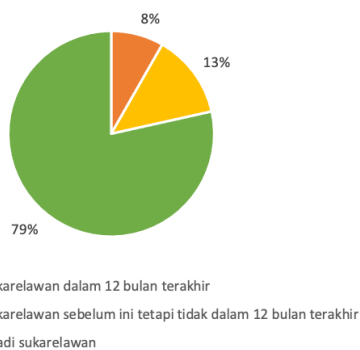
Rajah 2. Kadar Kesukarelawanan dalam kalangan Ahli SLP

Pada bulan Disember 2020, kami bertanya kepada ahli SLP mengenai kepuasan perkahwinan mereka. Kami mendapati perbezaan jantina dalam peratusan responden yang berpuas hati dengan perkahwinan mereka serta peratusan responden yang menyatakan bahawa hidup mereka akan terasa kosong tanpa perkahwinan mereka. Secara khusus, sebilangan besar responden lelaki melaporkan bahawa mereka berpuas hati dengan perkahwinan mereka dan kehidupan akan terasa kosong tanpa perkahwinan mereka berbanding dengan responden wanita.