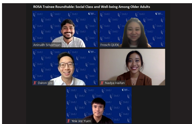
Gambar 1. Penyampai Pelatih di Meja Bulat Pelatih Pertama

Sejak awal penubuhan kami, ROSA telah disokong oleh pasukan pelatih berkebolehan yang diambil sebagai sebahagian daripada program SGUnited Traineeship. Pelatih kami telah memainkan peranan penting dalam meletakkan