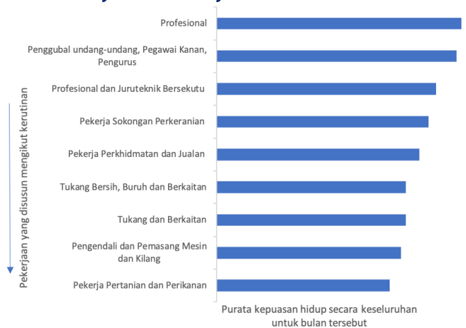
Rajah 1. Bahagian responden yang berpuas hati atau sangat berpuas hati dengan kehidupan dalam setiap kumpulan pekerjaan pada bulan Mei 2021.

Cara kerja seseorang yang rutin atau berulang-ulang dapat mempengaruhi kesejahteraan anda dengan pelbagai cara, misalnya dengan mewujudkan kebosanan, pengasingan sosial dan mengurangkan motivasi di tempat kerja. Oleh itu, semakin rutin sesuatu pekerjaan itu, semakin rendah kesejahteraan seseorang dalam pekerjaan tersebut. Pada bulan Mei 2021, kami telah bertanya kepada anggota SLP tentang tahap kerutinan yang dialami dalam pekerjaan mereka dan