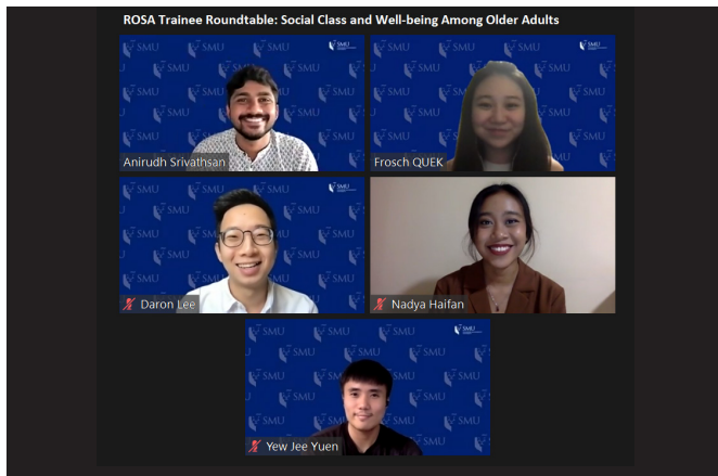
图一: 参加首届学员圆桌会议的主讲者

自成立以来, ROSA 获得了一群相当有能力的学员的支援。他们受雇于“新心相连”职场新人培训计划 (SGUnited Traineeship), 为奠定 ROSA 的基础扮演了重要角色。为了表扬他们的优异工作, 我们在 2021 年 6 月 7 日举行了首届学员圆桌会议。会议中, 他们向逾 40 名大学生和研究生分享他们的调查结果。我们希望类