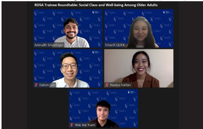
படம் 1. முதல் பயிலுநர் வட்டமேசை விவாதத்தில் பயிலுநர் உரையளிப்பாளர்கள்.

எங்கள் தொடக்கத்திலிருந்தே, எஸ்ஜி ஒற்றுமை வேலைப் பயிற்சித் திட்டத்தின் ஒரு பகுதியாகப் பணியமர்த்தப்பட்ட திறமையான வேலைப் பயிலுநர்களின் குழு ROSA-விற்கு ஆதரவளித்துள்ளது. ROSA-விற்கு அடித்தளம் அமைப்பதில்