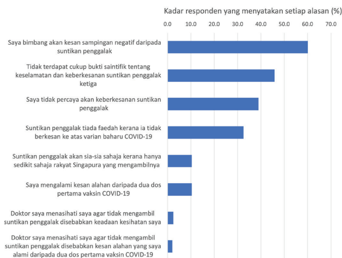
Rajah 2: Alasan yang dilaporkan untuk tidak mahu menerima suntikan penggalak

Responden yang tidak mahu mendapat suntikan penggalak seterusnya ditanya sebab mereka enggan mendapatkan suntikan penggalak. Tiga alasan yang paling banyak dinyatakan ialah mereka bimbang akan kesan sampingan negatif suntikan penggalak (60.1%), tidak terdapat cukup bukti saintifik tentang keselamatan dan keberkesanan suntikan penggalak ketiga (45.8%) dan mereka tidak percaya akan keberkesanan suntikan penggalak (38.9%).