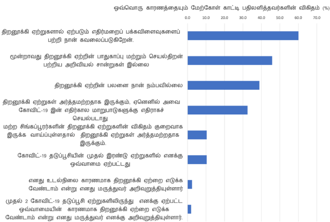
படம் 2: திறனாக்கி ஏற்றுக்கொள்ளப் பெற விரும்பாததற்குத் தெரிவிக்கப்பட்டுள்ள காரணங்கள்

திறனாக்கி ஏற்றுக்கொள்ளப் பெற விரும்பாத பதிலாளர்களிடம், அதற்கான காரணம் என்ன என்று கேட்கப்பட்டது. திறனாக்கி ஏற்றுக்கொள்ள எதிர்ப்பைப் பக்கவிளைவுகளைப் பற்றி அவர்கள் கவலைப்படுகிறார்கள் (60.1%), மூன்றாவது திறனாக்கி ஏற்றுக்கொள்ள பாதுகாப்பு மற்றும் செயல்திறன் பற்றிய அறிவியல் சான்றுகள் இல்லாதது (45.8%), மற்றும் திறனாக்கி ஏற்றுக்கொள்ள செயல்திறனை அவர்கள் நம்பவில்லை (38.9%) ஆகியவை அவர்களால் கூறப்பட்ட முதல் மூன்று பொதுவான காரணங்கள் ஆகும்.