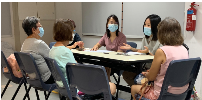
Pasukan ROSA mengadakan perbincangan kumpulan tumpuan bersama penduduk

Dalam bulan Januari 2022, ROSA telah bekerjasama dengan Persatuan Perkhidmatan Komuniti En dan telah melancarkan program rintis, "Inisiatif Berasaskan Komuniti dan Diketuai Peserta untuk Meningkatkan Penglibatan Sivik di Kalangan Warga Emas", yang menggalakkan warga emas untuk mengemukakan inisiatif komuniti dalam kejiranan mereka.