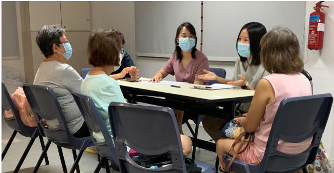
ROSA குழு குடியிருப்பாளர்களுடன் நோக்கக் குழுக்களை நடத்துகிறது

ஜனவரி 2022 இல், ROSA, 'En Community Services Society' உடன் கூட்டுசேர்ந்து, "மூப்படைந்தவர்களிடையே குடிமை ஈடுபாட்டை அதிகரிக்க, சமூக அடிப்படையிலான மற்றும் பங்கேற்பாளர் தலைமையிலான முன்முயற்சிகள்" என்ற ஒரு முன்னோடித் திட்டத்தை அறிமுகப்படுத்தியது. இது முதியவர்கள் தங்கள் சுற்றுப்புறத்தில் சமூக முயற்சிகளை ஏற்பாடுசெய்ய ஊக்குவிக்கிறது.