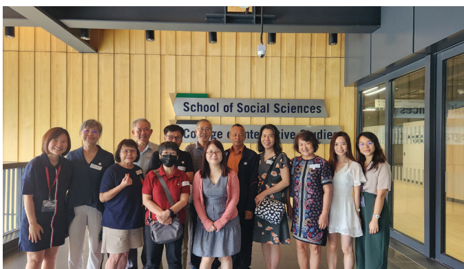
Ahli SLP yang telah menyertai sesi perjumpaan Januari (atas) dan Februari 2023 (bawah). Terima kasih kerana menyertai kami!