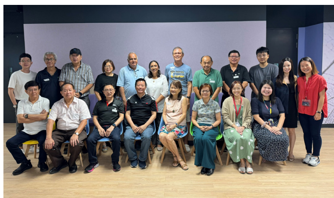
Ahli-ahli SLP yang menyertai sesi perjumpaan bulan Mac

Kami menghargai peluang bermakna dapat beramah mesra bersama para ahli SLP dan berterima kasih kerana anda meluangkan masa untuk hadir dan berkongsi pandangan bersama kami!