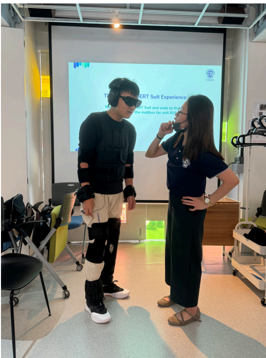
Ahli ROSA yang paling muda mencuba suit GERT yang lengkap!

Pengalaman amali ini melibatkan penggunaan suit GERT, iaitu sejenis alat khas yang dapat meniru dan menyerupai kekurangan penglihatan, pendengaran dan pergerakan yang biasa dialami oleh warga emas apabila mereka semakin meningkat usia. Simulasi terperinci ini membolehkan kami mengalami sendiri cabaran fizikal dan emosi yang mungkin dihadapi oleh warga emas setiap hari disebabkan masalah-masalah di atas. Pengalaman yang memberi kesedaran ini telah meluaskan lagi sudut pandang kami tentang penuaan, dan dapat memperkayakan usaha kerja kami, seterusnya membolehkan kami menyesuaikan usaha kami dengan keperluan warga tua mengikut konteks yang sepatutnya dengan lebih baik.