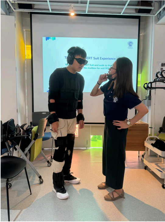
ROSA 最年轻的成员穿上全套的图形评审技术装备!

因素的因果发现”），同时也正在为 ROSA 撰写更多研究出版物。他擅长使用 TETRAD 等软件进行因果发现，并且希望利用本身的技能和专业知识，发掘崭新见解，进一步推动 ROSA 的研究工作。