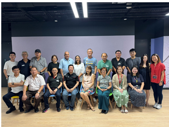
参加3月份见面会的 SLP 会员

我们很高兴有机会与 SLP 会员进行这些有意义的对谈，也感谢您拨冗出席，和我们分享您的看法！