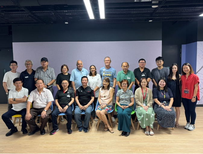
மார்ச் சந்திப்பு அமர்வில் எங்களுடன் இணைந்த SLP உறுப்பினர்கள்

தத்தமது இருப்பிடத்திலேயே மூப்படைதல் என்ற தலைப்பில், மூத்தோரை அவர்தம் இருப்பிடத்திலேயே மூப்படைய அனுமதிக்கும் நடவடிக்கைகளை SLP உறுப்பினர்கள் வரவேற்றனர், சிலர் அவ்வாறு செய்வதற்காகும் செலவுக் கட்டுபடி மற்றும் வயதாகும்போது சமூகத் தொடர்புகளைப் பேணுவதில் மூத்தோருக்கு உள்ள சிரமங்கள் குறித்து கவலை தெரிவித்தனர். மூத்தோர்களைச் சிறப்பாக ஆதரிக்க, அவர்கள் உதவிவசதிகளை அணுகுவதை அதிகரிக்க இன்னும் பலவற்றைச் செய்யலாம் என உறுப்பினர்கள் பரிந்துரைத்தனர்.