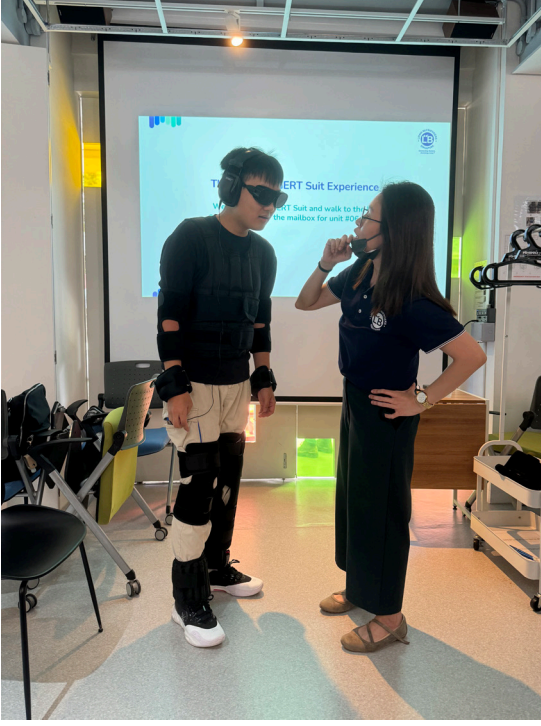
எங்களின் ஆக இளைய ROSA உறுப்பினர் முழு GERT உடையை முயற்சி செய்கிறார்!

காரணி-விளைவு தொடர்புகளைக் கண்டுபிடிப்பிற்கான TETRAD போன்ற மென்பொருளைப் பயன்படுத்துவதில் நிபுணத்துவம் பெற்ற அவர், தனது திறமைகளையும் நிபுணத்துவத்தையும் பல புதிய நுண்ணறிவுகளையும் மேற்கொண்டு பல ROSA-வின் ஆராய்ச்சி முயற்சிகளையும் வெளிக்கொணரப் பயன்படுத்த முடியும் என்று நம்புகிறார்.