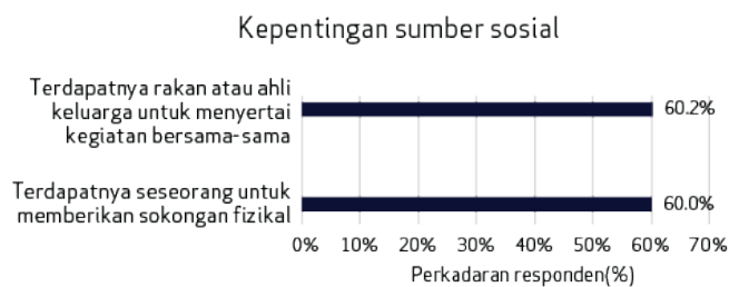
Rajah 3. Kadar responden yang memberikan nilai terhadap setiap sumber sosial sebagai penting.

Ini menunjukkan bahawa ramai di antara anda yang masih mempertimbangkan kepentingan praktikal seperti kemudahan lokasi, ketersediaan maklumat penting, serta manfaat penyertaan, selain keselesaan peribadi seperti persekitaran yang selesa dan kakitangan yang mesra. Kami akan menjalankan analisis lanjut berkenaan data yang dikumpulkan dan berkongsi maklumat ini dengan Agensi Penjagaan Bersepadu (AIC), yang telah memulakan modul tinjauan ini.