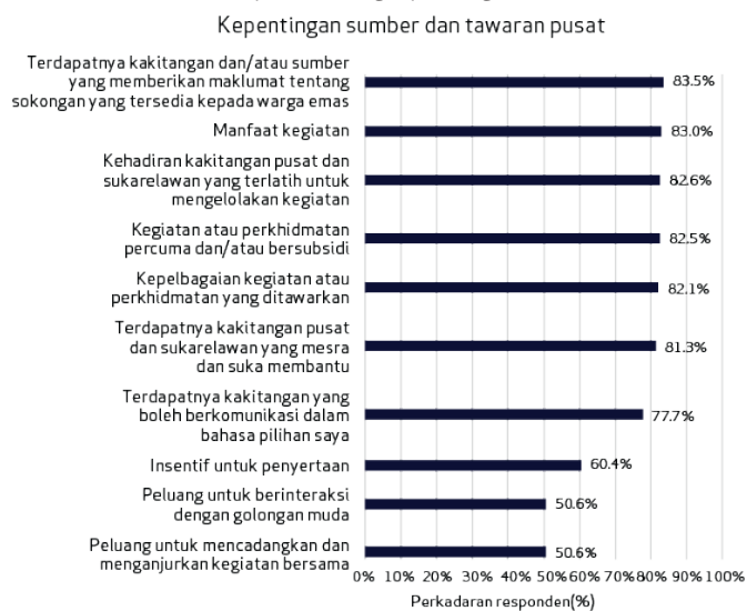
Rajah 2. Kadar responden yang memberikan nilai terhadap setiap ciri pusat sebagai penting.

Dari segi sumber sosial, lebih kurang 3 daripada 5 responden berpendapat bahawa mempunyai rakan atau ahli keluarga yang dapat menyertai aktiviti bersama mereka, serta seseorang yang boleh memberikan sokongan fizikal (contohnya, menyediakan pengangkutan untuk pergi dan balik dari pusat) adalah faktor penting ketika mengunjungi AAC.