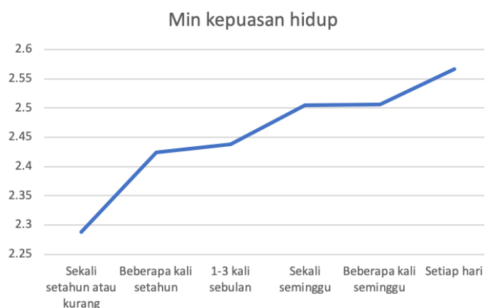
Rajah 2: Kekerapan yang lebih tinggi bersembang dengan jiran dikaitkan dengan purata kepuasan hidup yang lebih tinggi

Dapatan kami juga mencadangkan bahawa lebih banyak berhubung dengan jiran tetangga dan memupuk hubungan dengan mereka, dapat mewujudkan persekitaran yang lebih baik dari segi kepuasan hidup. Kami juga mendapati bahawa responden lebih muda kurang kerap berinteraksi dengan jiran tetangga berbanding responden lebih tua. Seharusnya kita mengambil teladan daripada orang tua untuk lebih banyak berinteraksi dengan jiran tetangga supaya kita dapat menjalani kehidupan yang lebih bahagia!