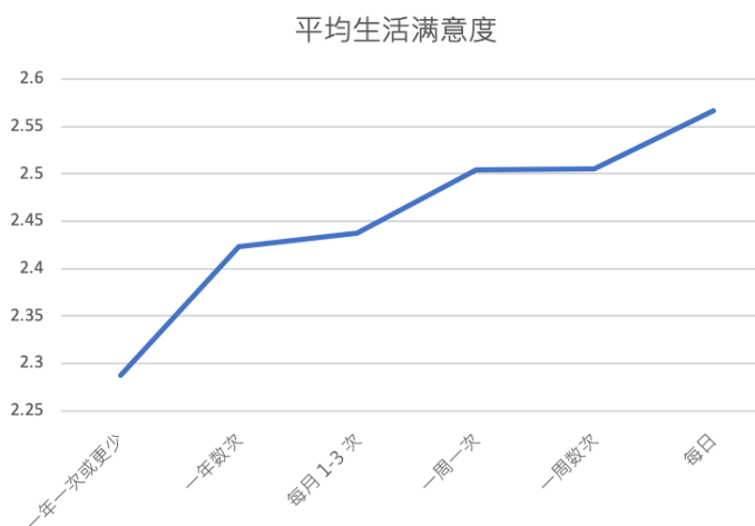
图 2: 邻居聊天的频率越高, 平均生活满意度越高

我们的研究也建议, 多和邻居接触、联络感情, 能为我们的生活满意度创造更好的环境。进一步研究显示, 与年纪较大的受访者相比, 较年轻的受访者倾向较少和邻居互动。因此, 我们应该向年长者学习, 多和邻居互动, 有助我们拥有更满意的生活!